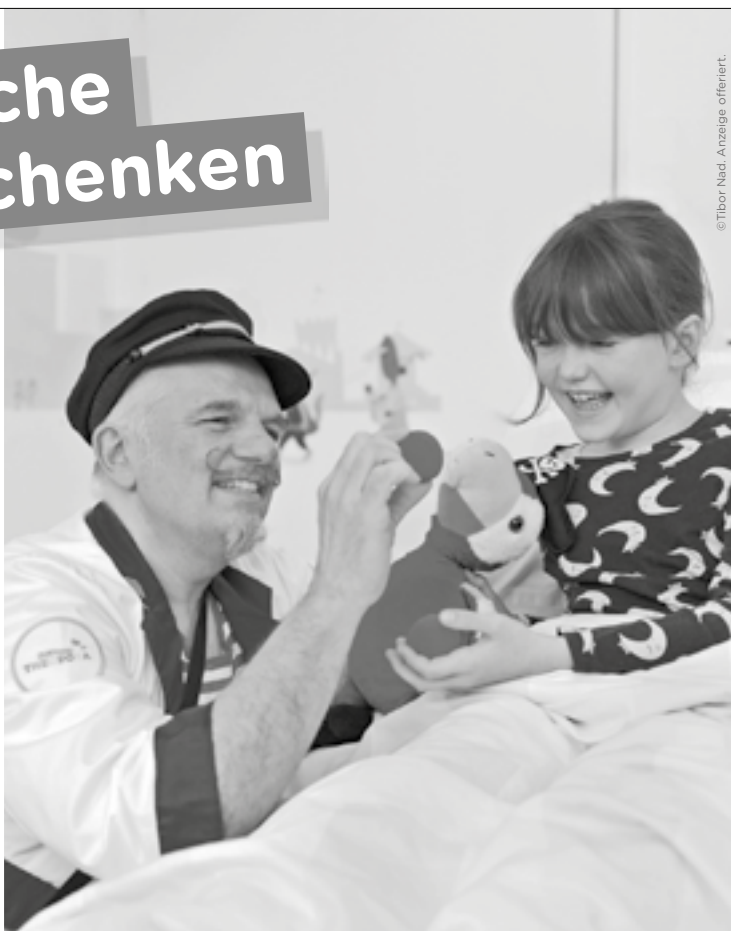
Anzeige offeriert.